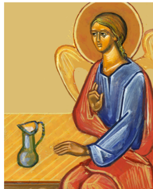
Détail de l'Hospitalité d'Abraham