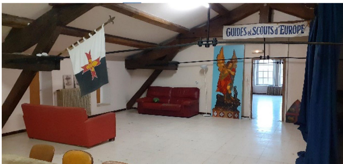
Notre Kraal au local du Bon Pasteur