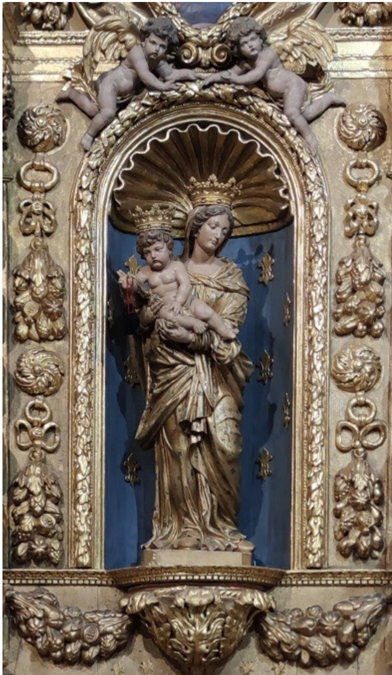
Chapelle Notre Dame du Bon-Remède