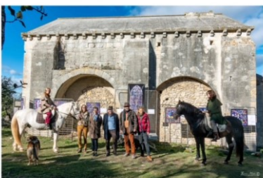
Chapelle Saint-Julien Boulbon - Février 2018 Association Saint-Julien en Héritage